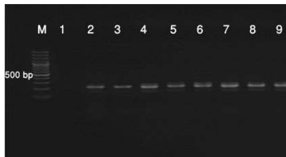
شکل ۱- نتایج آزمون PCR ژن mecA (۱۶۳ جفت باز) برای تعدادی از جدایه‌های استافیلوکوکوس اورئوس مورد مطالعه؛ ستون M: نشانگر ۱۰۰ bp، ستون ۱: کنترل منفی، ستون‌های ۳-۹: نمونه‌های مورد بررسی.

براساس آزمایش‌های فنوتیپی از ۲۰۸ نمونه جمع-آوری شده، تعداد ۴۲ (۲۰/۵۴ درصد) جدایه به عنوان استافیلوکوکوس اورئوس شناسایی شدند. نتایج آزمایش تعیین میزان حساسیت آنتی‌بیوتیکی ۴۲ جدایه تأیید شده به عنوان استافیلوکوکوس اورئوس به روش انتشار در ژل در جدول (۲) درج شده‌است. تعداد ۲۳ (۵۷/۳۸ درصد) جدایه مقاوم به اگزاسیلین بودند. بیشترین مقاومت آنتی-بیوتیکی به پنی‌سیلین (۱۰۰ درصد) و کمترین مقاومت به کلرامفنیکل (۱/۲۰ درصد) مشاهده گردید. هیچ‌یک از جدایه‌ها نسبت به آنتی‌بیوتیک‌های سیپروفلوکساسین و